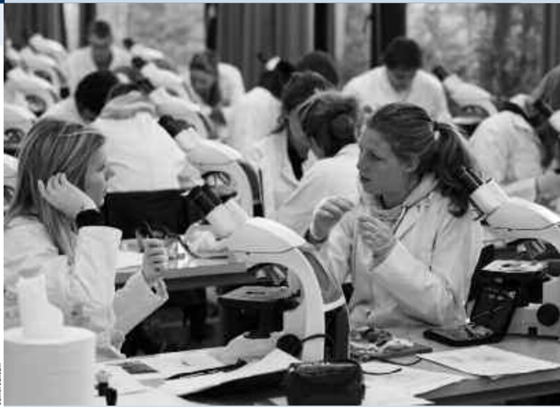
Les auditorios de médecine restent « bondés », mais aussi ceux de dentisterie, vétérinaire et sciences biomédicales.