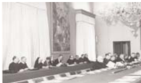
(sous)commission conciliaire au travail. (Fonds Ch. Moeller, n°1347)