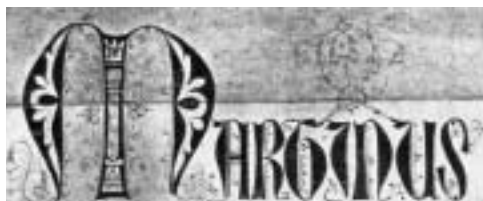
Martin, le premier mot de la bulle Sapientiae Immarcescibilis, 1425.