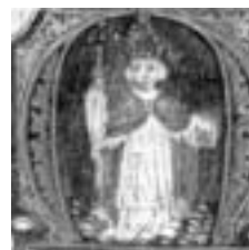
Martin V. Détail du cartulaire de 1450.