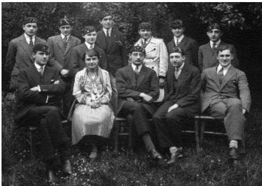
Le comité de l'Aucam (Association universitaire catholique pour l'aide aux missions) à Louvain en 1927-1928