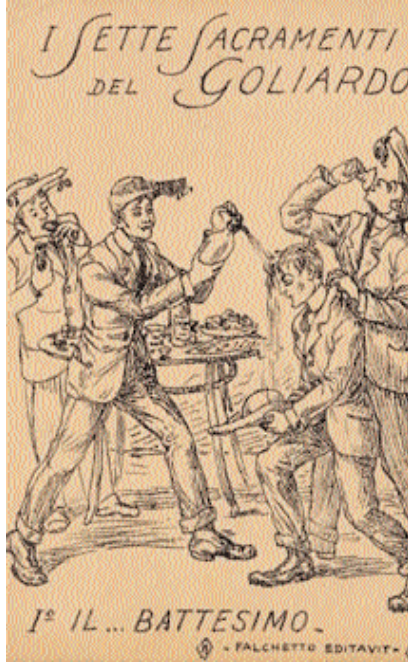
Collezioni cartoline Dono Russo II/ 012.Russo.II Archivio Storico, Bologna

Des milliers de jeunes y ont défilé, ont mis en place des règles de vie commune, des rites, des cérémonies pour donner un sens à leur