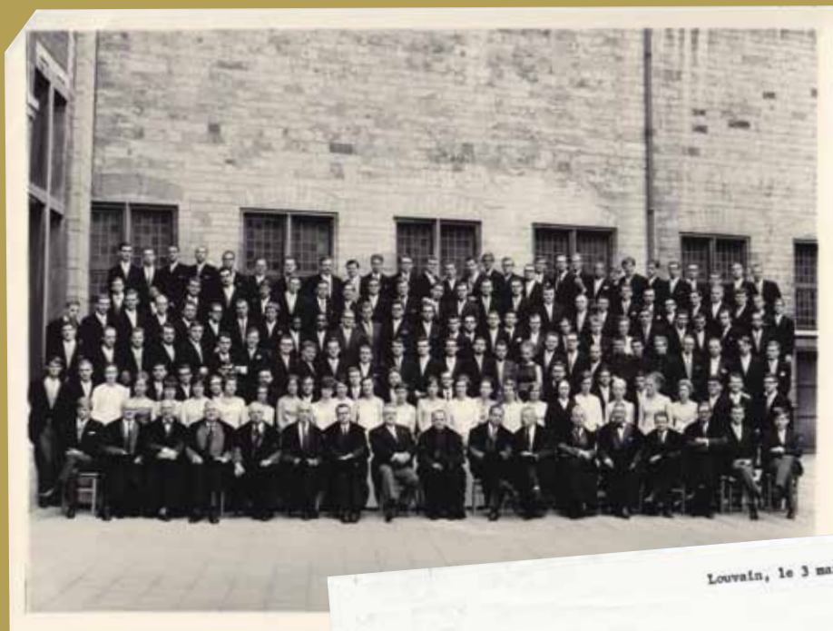
La promotion des médecins en juin 1966

Très actif, le Centre international des étudiants étrangers souhaite être associé à la « Commission de contact » avec les étudiants