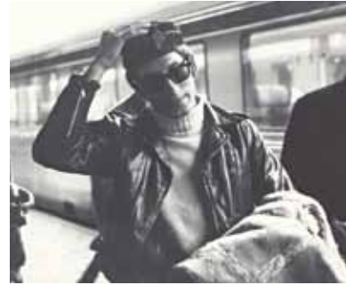
Les étudiants francophones invitèrent Jacques Dutronc en 1966

L'accès aux études supérieures s'ouvrait comme il ne l'avait jamais fait auparavant, profilant une économie et une société nouvelles. Les individus s'installaient dans un système de bien-être et de consommation. Bientôt, aurait lieu une essentielle révolution de la sexualité et de la procréation et se ferait jour une première prise de conscience écologique.