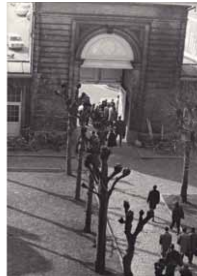
Étudiants au Collège du Faucon

Art 4 : L'Université est placée sous la haute direction de l'assemblée des Évêques résidentiels de Belgique qui en constituent le pouvoir organisateur. – L'administration de l'Université est assurée par des institutions communes aux deux sections linguistiques, par des institutions propres à chacune de ces Sections et par des organes de la faculté. – [...] Les Institutions propres à chaque Section sont : le Conseil académique, le Bureau du Conseil académique, le Conseil financier, le Prorecteur, l'Administrateur général, le Vice-Recteur, le Conseiller scientifique.