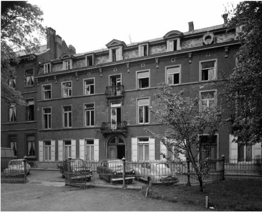
La résidence Sedes Sapientiae en 1958