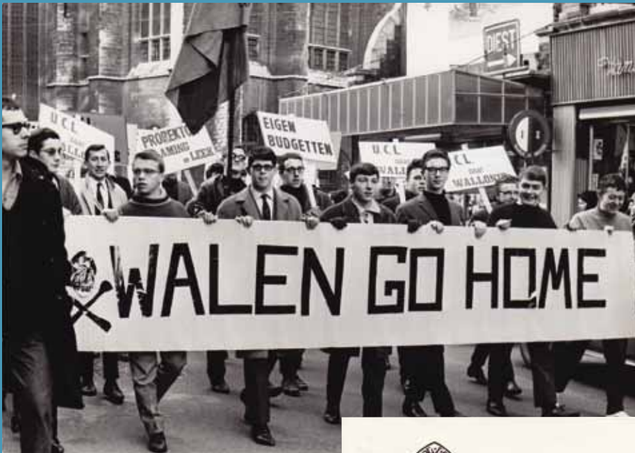
Les revendications des étudiants flamands en décembre 1965