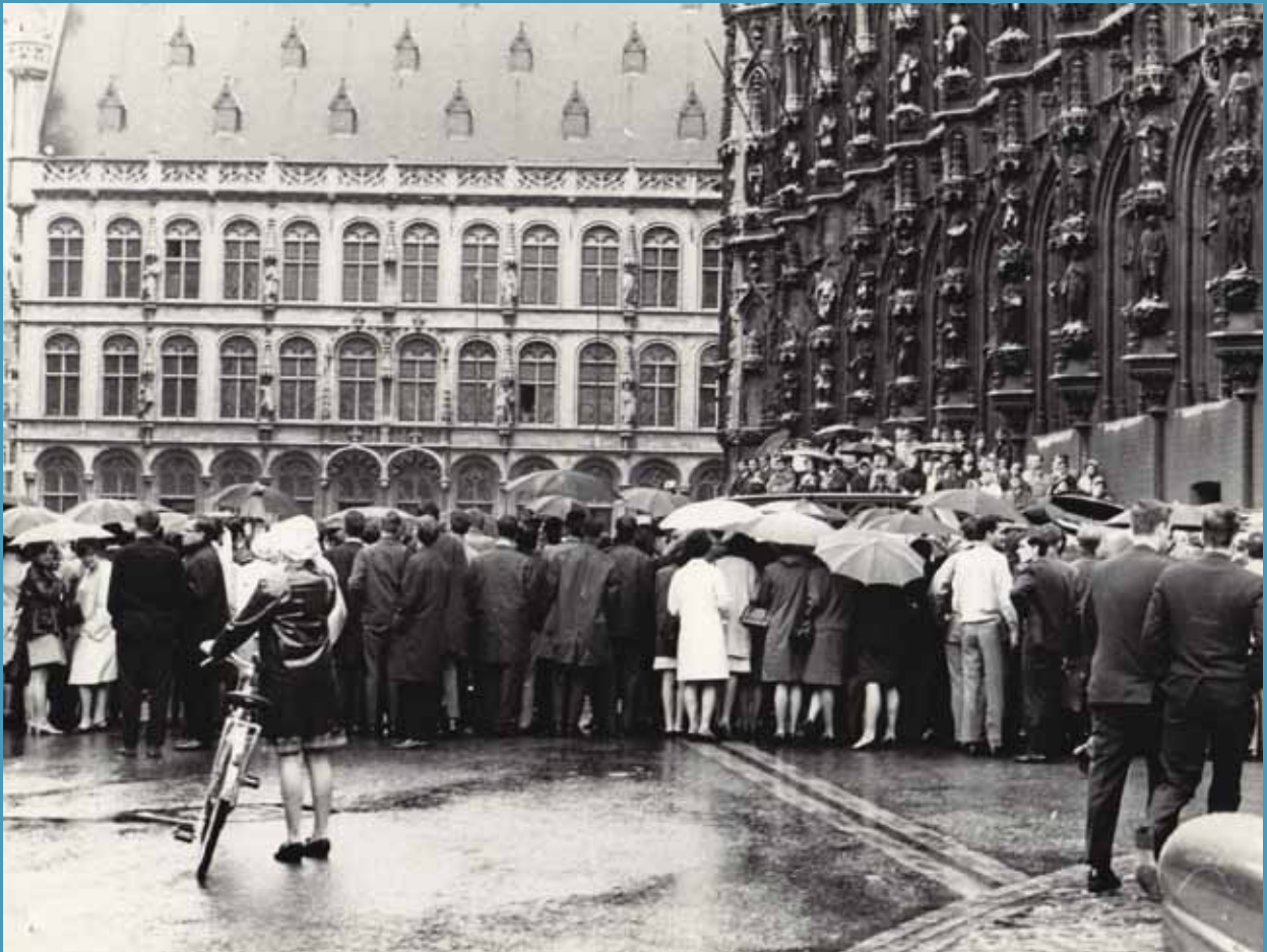
Les étudiants flamands tournent le dos au cortège de la rentrée universitaire en octobre 1966