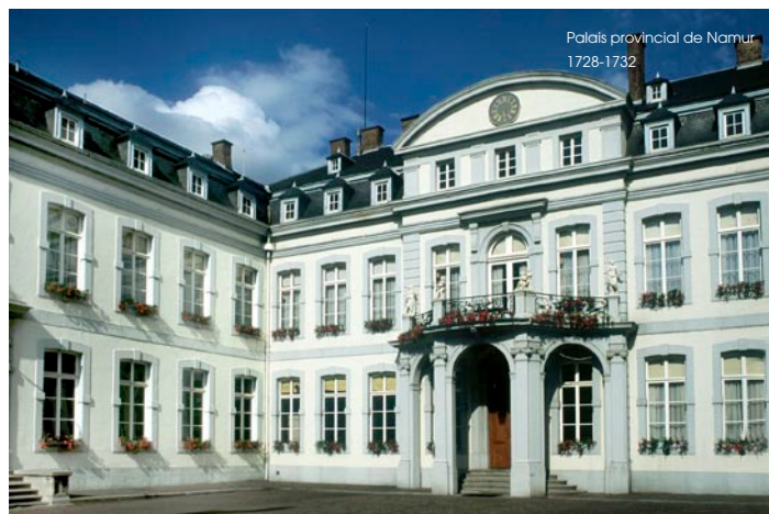
Palais provincial de Namur 1728-1732