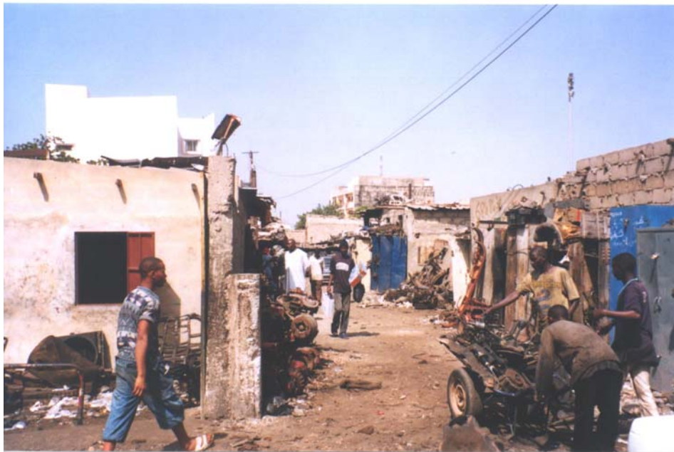
Cliché : J. Lombard, 2004