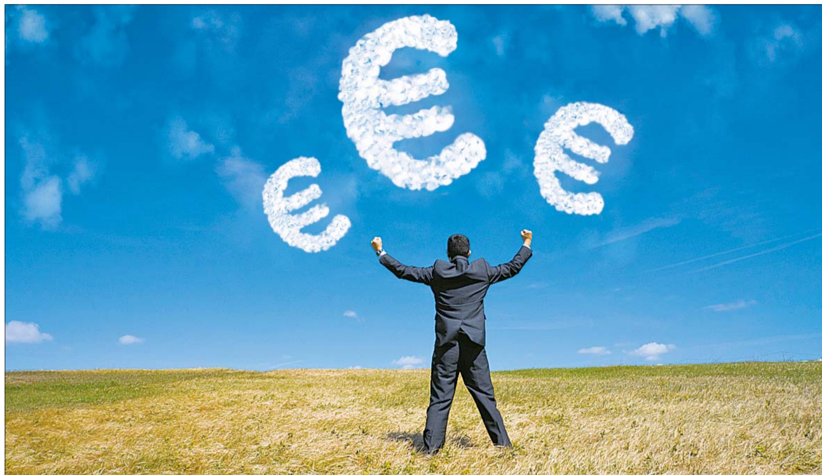
Geld allein macht nicht glücklich. Aber was sind die richtigen Indikatoren? Was wollen wir messen?

Zur Zeit wird überall auf der Welt darüber nachgedacht. Seit 1990 veröffentlicht das „United Nations Development Programme“ den „Indikator menschlicher Entwicklung“, der drei Informationen kombiniert: das Einkommen, die Ausbildung und den Gesundheitszustand. Dieser Wert ist schon nuancierter. Aber heute gewinnt auch die Rolle der Umwelt in der Statistik ein immer größeres Gewicht. Welchen Einfluss hat unser Dasein auf die vorhandenen Ressourcen, die auf unserem Planeten begrenzt sind? Es gibt heute schon eine ganze Reihe alternativer Indikatoren. Das wird auch klar, wenn man den Bericht der Stiglitz-Kommission liest. Den Vorsitz dieser UN-Kommission