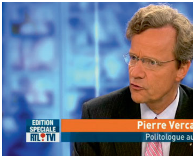
RTL/TVI - Journal télévisé