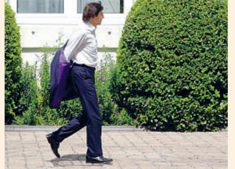
Elio Di Rupo viert maandag zijn zestigste verjaardag maar zal, opnieuw, vooral aan BHV moeten denken.

Bij CD&V wordt de voortzetting van de regering in lopende zaken nog altijd als een vluchtheuvel gezien, om niet te moeten kiezen tussen de pest en de cholera: een regering zonder de N-VA of verkiezingen. Maar ook dan dreigt CD&V opnieuw snel in de problemen te komen. Al was het maar omdat de lopende zaken dan vlug vastlopende zaken kunnen worden, als CD&V Di Rupo alsnog zou doen mislukken.