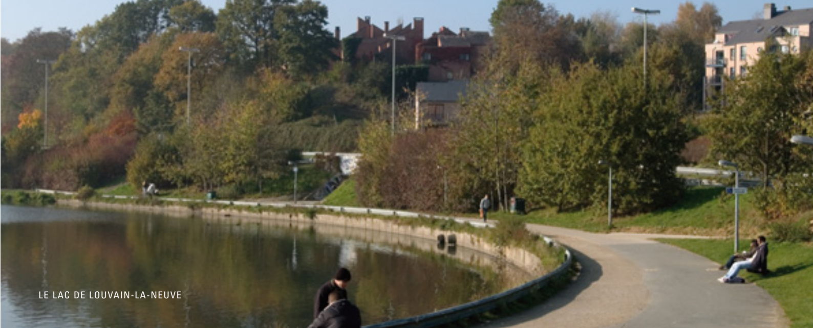
LE LAC DE LOUVAIN-LA-NEUVE