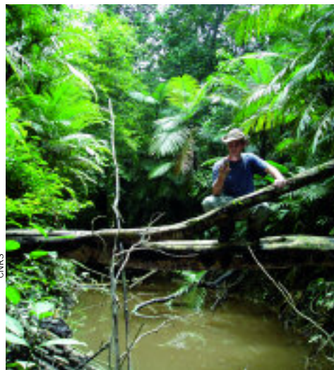
— Dans certains pays en développement, les forêts sont en augmentation.