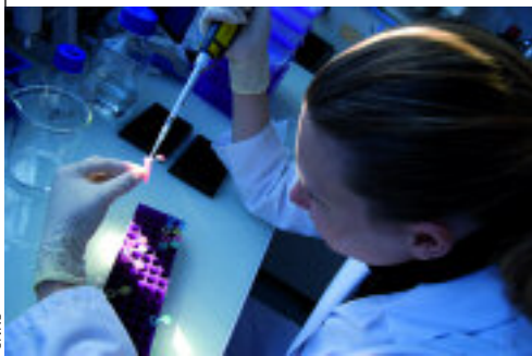
— En laboratoire, les chercheurs élaborent les antibiotiques de demain.