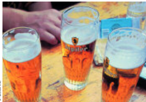
— La consommation excessive d'alcool, même espacée, conduit à un ralentissement de l'activité cérébrale.

base d'enregistrements de l'activité cérébrale, un ralentissement de l'activité cérébrale après seulement neuf mois de binge drinking. Ces données sont techniquement difficiles à générer (il faut éviter les interférences, les stocker, les traiter,...). C'est pour cette raison que l'Institut réfléchit à la création d'une plateforme technologique. Un consultant vient d'être engagé pour les analyses statistiques de haut niveau de même qu'un gestionnaire de recherche.