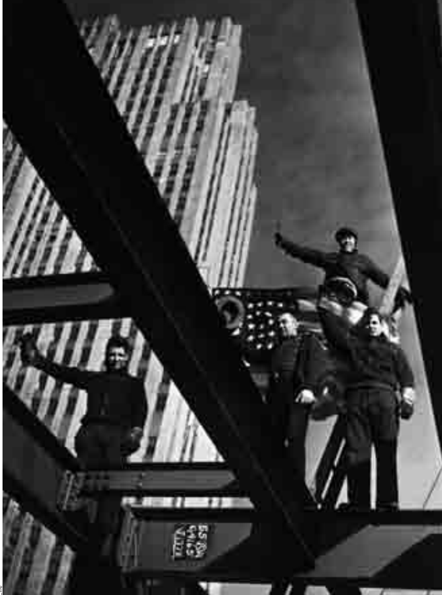
Des sidérurgistes au 36 e étage du Rockefeller Center, construit en un temps record en 1931.

Témoignant de la crise du modèle libéral, la crise des années 1880 s'accompagne de changements technologiques majeurs dans les secteurs de la chimie et de l'électricité. Ils bouleversent un paysage industriel dominé, depuis la révolution industrielle, par le charbon et l'acier. En termes de paysage mental, cette crise des années 1880 encourage la lente mais inexorable montée en puissance d'un nationalisme économique jouant volontiers de