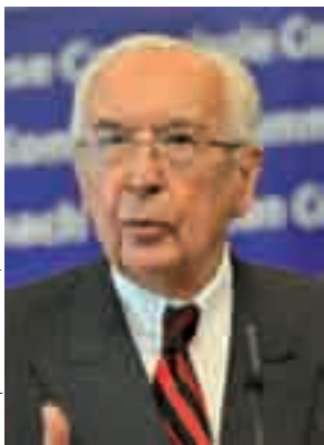
European Communities, 2009

— Les rapports —dont celui de Jacques de Larosière pour la Commission européenne— se sont multipliés pour analyser les causes de la crise et proposer des réformes de la réglementation.