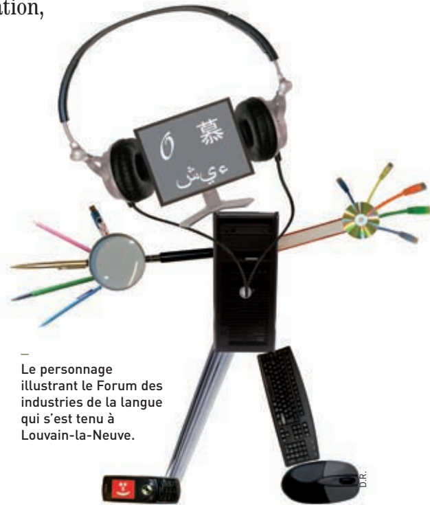
Le personnage illustrant le Forum des industries de la langue qui s'est tenu à Louvain-la-Neuve.

Acapela en est un. Ce logiciel transforme n'importe quel texte écrit en parole naturelle, dans 25 langues. Audioguide touristique sur iPhone, numéro d'appel indiquant la pharmacie la plus proche, vocalisation en self-service... les usages sont multiples, commerciaux ou non (un test est accessible en ligne à l'adresse www.acapela-group.com/text-to-speech-interactive-demo.html ). Autre exemple: Antidote, qui réunit un correcteur, douze dictionnaires et onze guides linguistiques. Tout l'arsenal du parfait rédacteur! Cet outil s'ajoute