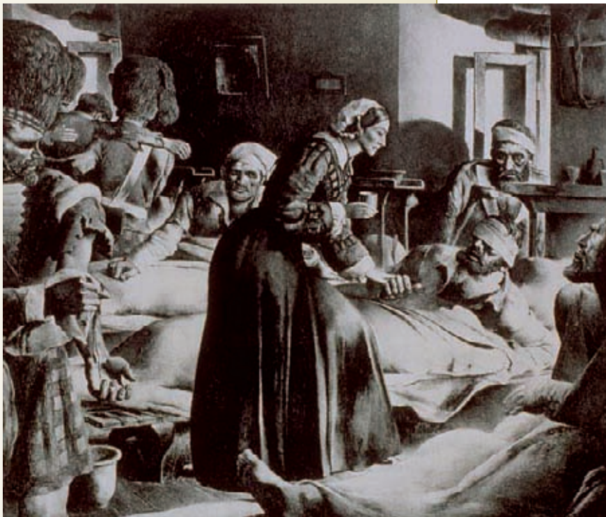
Florence Nightingale, ici sur une gravure, fut une pionnière du métier d'infirmière au XIX e siècle.

Bien que prometteur tant en termes d'impact social qu'économique, notamment en termes de création d'emplois, l'entrepreneuriat social est aujourd'hui freiné par ces défis qu'académiques, pouvoirs publics et citoyens responsables doivent ensemble s'ingénier à relever. ■