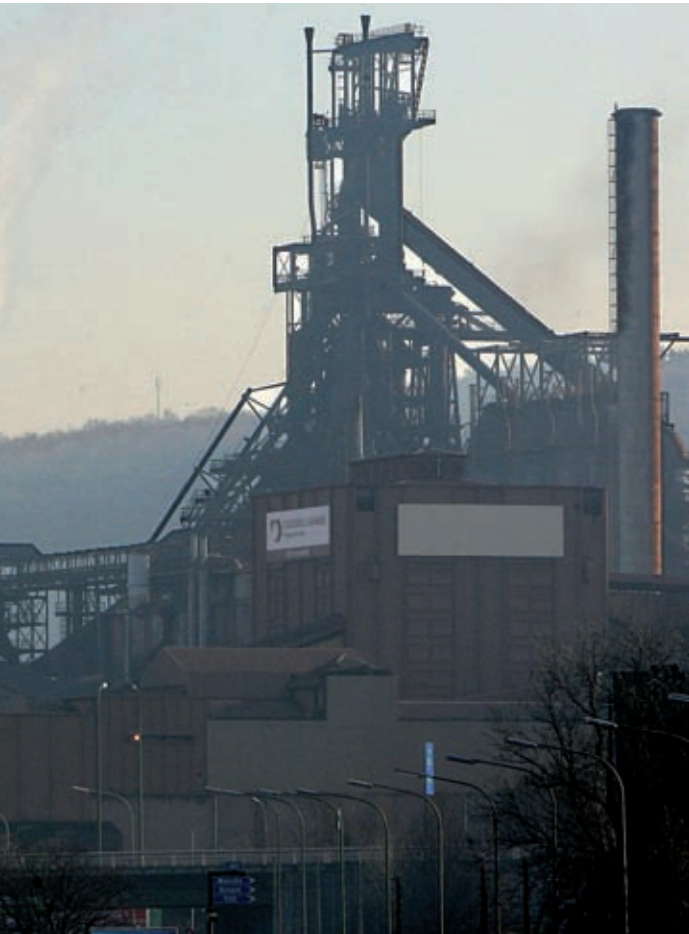
Le haut fourneau de Cockerill Sambre à Ougrée, fleuron de l'industrie belge au début du xx e siècle, repris depuis par ArcelorMittal.