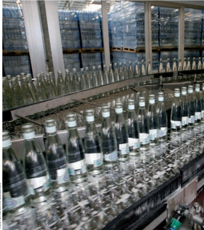
Entre la fin de la deuxième guerre mondiale et les années septante, les grandes entreprises ont dominé l'économie. Ici, une usine d'embouteillage d'eau minérale récemment rachetée par la multinationale Nestlé.

L'entrepreneur occupera également une place importante dans les travaux de l'école économique allemande du XIX e siècle pour laquelle le talent entrepreneurial est une ressource rare et le profit, la récompense du risque