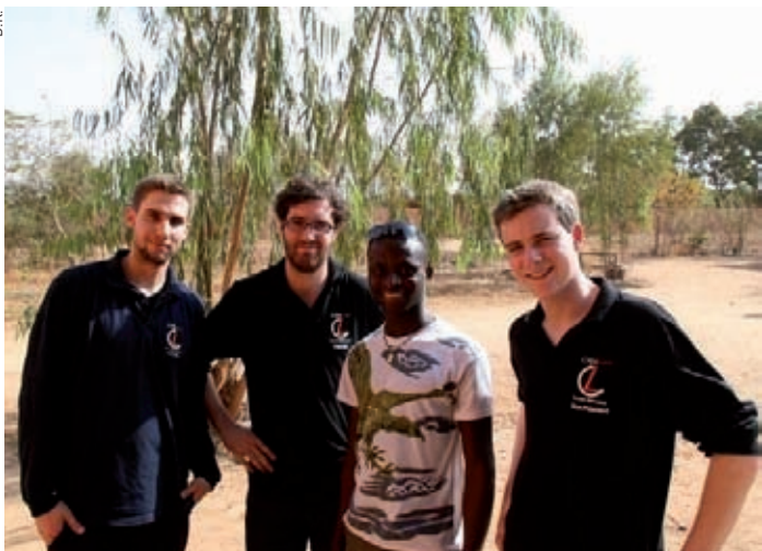
Des étudiants de Créalouv, le club des étudiants entrepreneurs de Louvain-la-Neuve, se sont rendus récemment au Burkina Faso pour y rencontrer des étudiants et jeunes indépendants burkinabés.

l'évitement de l'incertitude et le degré de tolérance des sociétés pour l'ambiguïté: plus l'évitement est marqué, moins la société serait encline à l'esprit d'entreprendre. Mais selon l'approche par l'insatisfaction, le résultat attendu peut être inversé!