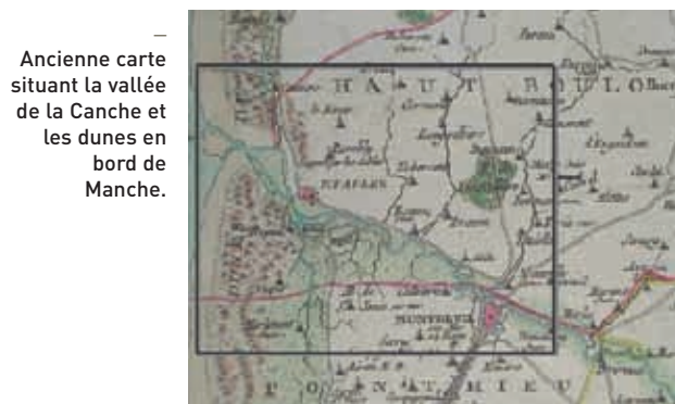
— Ancienne carte situant la vallée de la Canche et les dunes en bord de Manche.