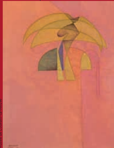
Musée de Louvain-la-Neuve

→ Du 2 juillet au 31 août, Forum des Halles, Louvain-la-Neuve www.uclouvain.be/culture