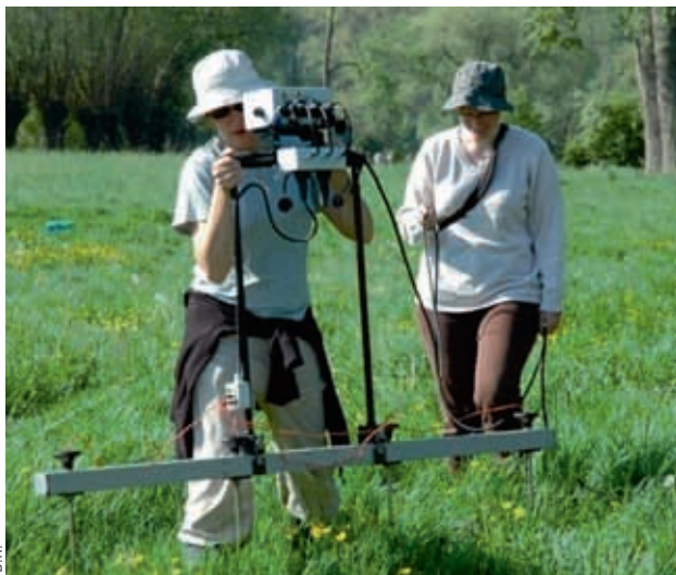
— Campagne de tests de prospections électromagnétiques et de résistivité électrique par les Universités de La Rochelle et de Louvain à La Caloterie, en vue de repérer les infrastructures et chenaux portuaires.