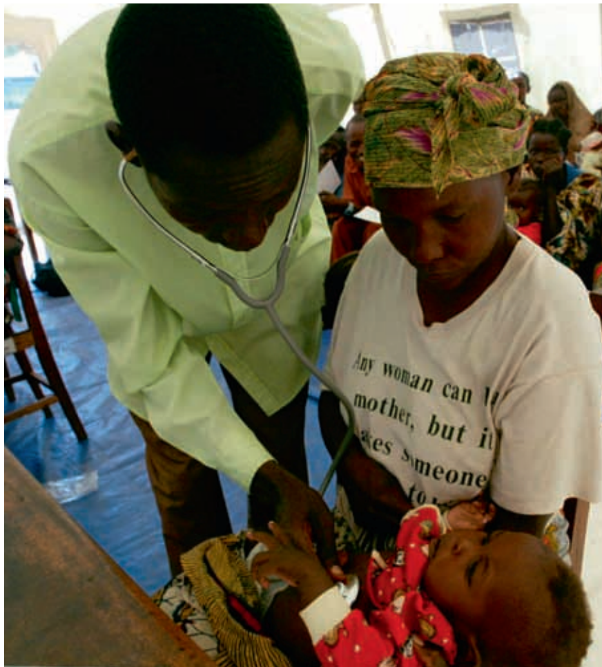
L'accès aux soins n'est pas garanti équitablement à tous les Congolais. Ici un médecin examinant un bébé à Bunia.

Cela ressort clairement des entretiens réalisés dans le cadre de la recherche sur les enjeux sociaux de la douleur menée par le Pr B. Lapika, anthropologue à l'Unikin: la douleur est le premier motif de consultation vers la médecine allopathique. Les patients attendent un soulagement immédiat bien avant d'attendre la guérison. Mais ils éprouvent des difficultés considérables à qualifier et évaluer la douleur qu'ils éprouvent. La décision de se tourner vers un hôpital et la prise en charge de la douleur se font sur le mode communautaire.