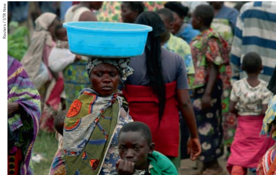
Les conditions de vie des habitants dans la région du Nord-Kivu ont été mises à mal par les conflits armés. Ici, un camp de réfugiés géré par la MONUC.

Interlocutrice privilégiée des organisations internatio-