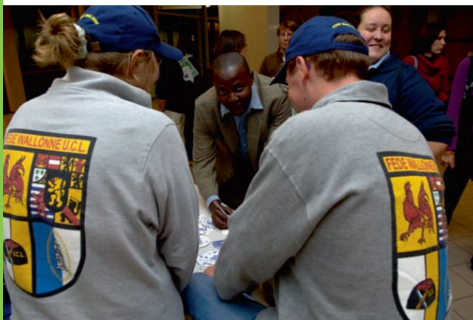
Les collectifs étudiants, notamment les Régionales, participent à l'intégration des étudiants.

Un groupe émanant du vice-rectorat aux Affaires étudiantes se préoccupe aujourd'hui d'étendre la labellisation d'étudiants à profil spécifiques à des étudiants