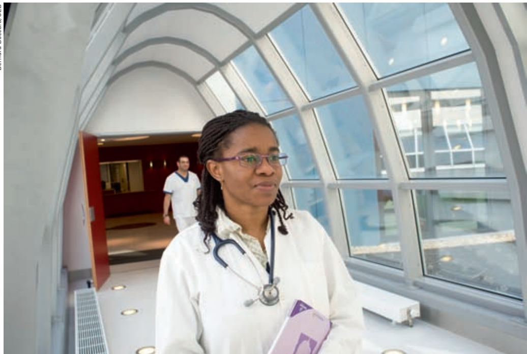
Photo extraite de l'exposition «Les voyageurs du savoir», à voir jusqu'au 16 juillet 2011, à l'ULB.