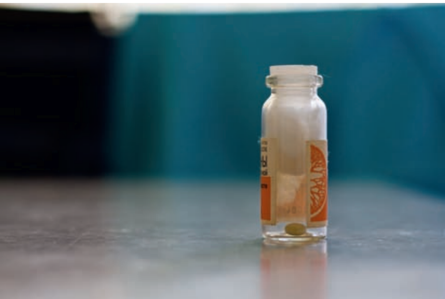
Person Behind the Scenes

Chez les personnes âgées, certains médicaments sont à éviter.