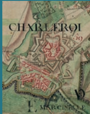
— Carte de Ferraris de la ville de Charleroi

C'est une histoire de rois. Au prime abord, dans un toponyme aussi transparent, on aimerait retrouver l'ascendant d'un carolus rex issu de la latinité tardive. Mais il faut vite déchanter, cette voie royale étant sans issue. Les Charles furent pourtant légion dans les dynasties de l'Europe médiévale. Au point que pour les distinguer on les affubla de surnoms tels que le Gros, le Bègue, le Chauve, le Simple, le Téméraire. Sans oublier Martel, -magne et Quint. Or provisoirement ce cortège de monarques, qui furent à la fois Charles et rois, ne mena pas à Charleroi .