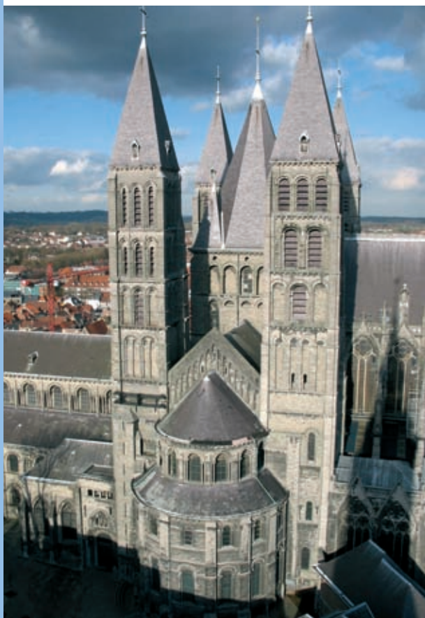
— La Cathédrale de Tournai inscrite au patrimoine de l'Unesco, est un fleuron du patrimoine hennuyer.

Le Hainaut est, à juste titre, associé à son incomparable patrimoine architectural qui s'est constitué au fil des siècles, léguant un tissu urbain de grande qualité. La cathédrale de Tournai, inscrite au patrimoine de l'Unesco, en est un des fleurons.