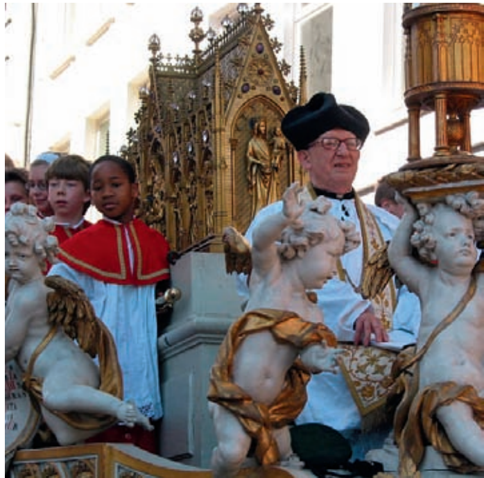
Du chemin reste à parcourir pour Mons 2015, en termes d'infrastructures, de notoriété et d'adhésion de la population montoise au projet.

Évoquant la passerelle jetée entre le passé patrimonial et culturel de la ville et son développement en devenir dans le domaine des arts et techniques numériques, Where technology meets culture est un des fils conducteurs du projet montois. Il est vrai que dans le contexte particulier d'une région d'Europe parmi les plus riches du monde il y a un siècle et qui relève aujourd'hui la tête après le choc du passage à l'ère post-industrielle, l'«opération 2015», dont le budget de base est de 78 millions d'euros, est, en termes non seulement culturels mais aussi socio-économiques, une extraordinaire opportunité. L'exemple de la grande voisine transfrontalière - Lille, capitale européenne en 2004 - est à ce titre des plus encourageants : pour un