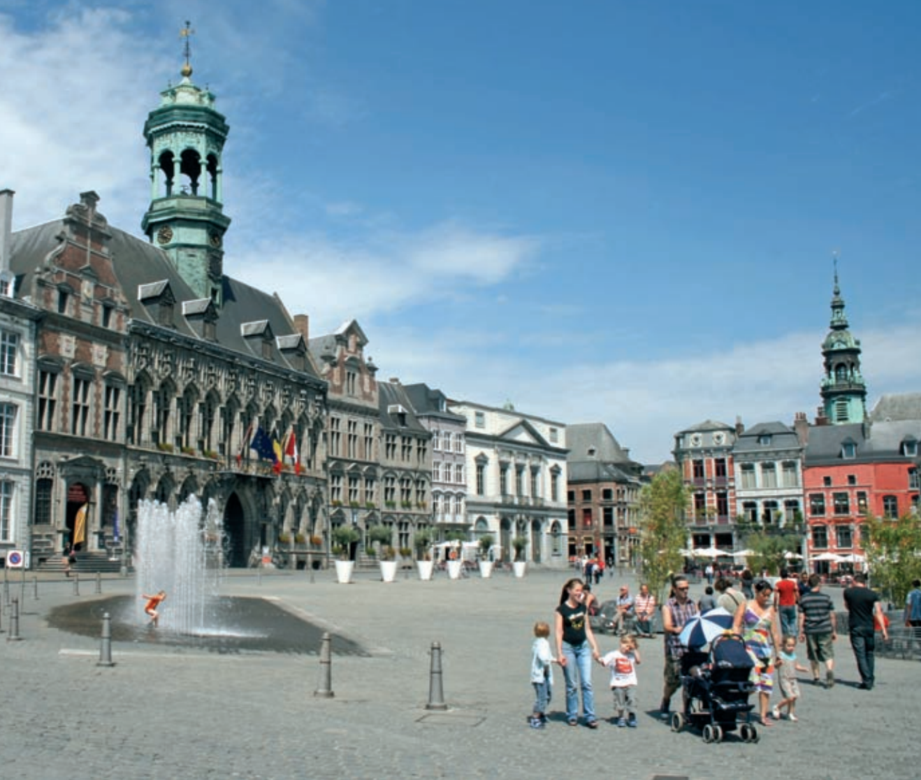
Office de Tourisme de Mons

Mons sera en 2015, la capitale européenne de la culture.