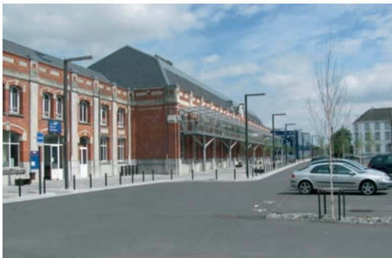
La gare de Marchienne-au-Pont a été rénovée. Juste en face se trouve l'association culturelle de l'amitié belgo-turque, signe de la mixité culturelle du quartier.

jets à finalité artistique, patrimoniale, naturaliste, sportive, sociale, professionnelle... se développent pour rendre vivant et liant l'espace urbain au cœur d'une région en reconstruction. Mais plus encore, ils reflètent la capacité d'individus et de groupes à créer des espaces de liberté, de convivialité et de rencontre mais aussi à agir comme citoyens responsables et sujets de la modernité. ■