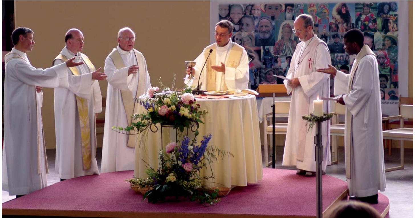
Concélébration à Stockel

Dès septembre 1995, l'équipe pastorale de l'Unité (formée des équipes pastorales des entités composantes) se réunit. Elle définit les secteurs dans lesquels une collaboration pourrait être envisagée et ceux pour lesquels une autonomie res-