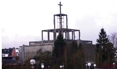
Eglise en construction

Une église n'est ni un musée, ni la mémoire du passé. Elle est le lieu de rassemblement et de célébration de la communauté chrétienne. Une nouvelle église doit donc être adaptée aux exigences de son époque. Les finances, de leur côté, doivent être gérées au mieux et le bâtiment n'est pas tout ! En 1960, le but était de construire, au moindre coût, une église de 750 places, dotée d'une chapelle de semaine de 150 places, de sacristies et locaux divers. Il n'est donc pas question pour les architectes AERTS et RAMON de plagier un style ancien, mais de se tourner vers un genre et un matériau résolument moderne : le béton.