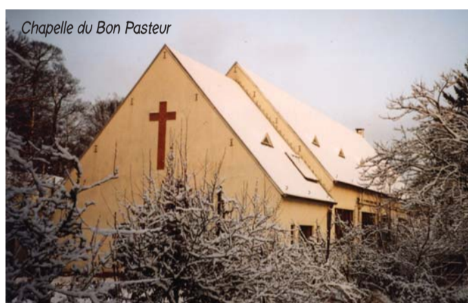
Chapelle du Bon Pasteur