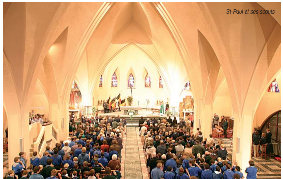
St-Paul et ses scouts