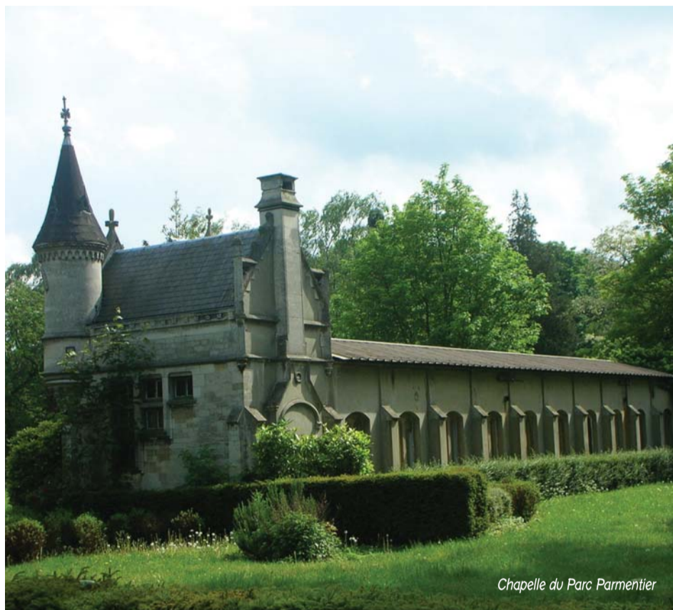
Chapelle du Parc Parmentier

Pour chaque enfant en activité au sein de notre association, le projet pédagogique vise à :