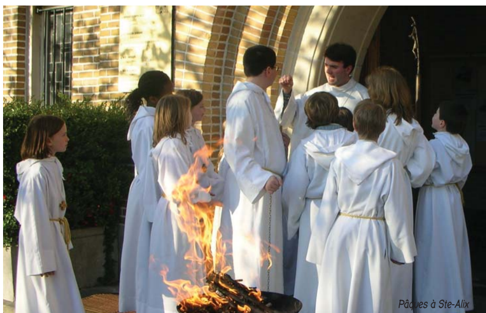
Pâques à Ste-Alix