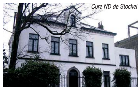
Cure ND de Stockel

La construction se caractérise par une couronne de plan carré, constituée de 20 colonnes qui supportent au niveau inférieur un plancher de poutres se prolongeant vers la rue Vandermaelen et recevant à ses extrémités l'ossature verticale des façades extérieures. Cette couronne porte dans sa partie supérieure la toiture et un ensemble de poutres en béton supportant la croix et les cloches, jouant ainsi le rôle de clocher. Une bande complètement vitrée s'interpose entre la couronne extérieure et la toiture.