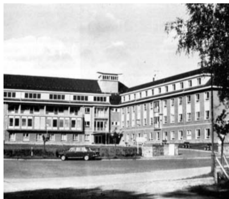
Résidence Roi Baudouin