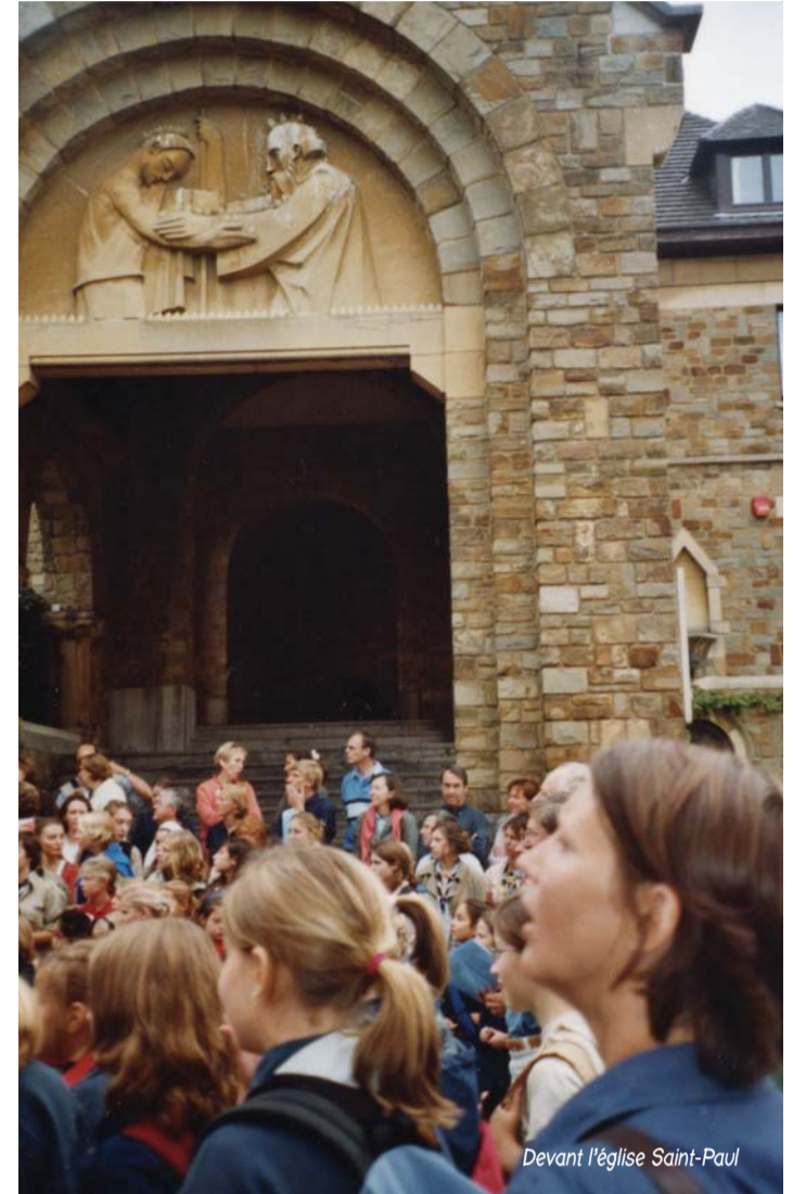
Devant l'église Saint-Paul

Pas sans vous, donc... L'Équipe Pastorale de Saint-Paul