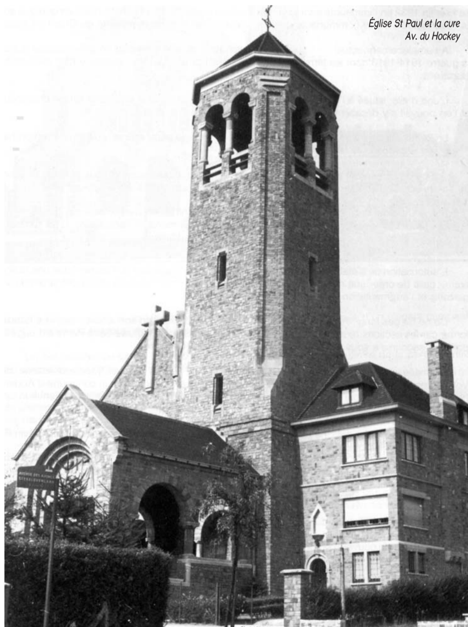
Église St Paul et la cure Av. du Hockey

Il est hors de doute que l'église Saint-Paul et son presbytère constituent un des plus beaux ensembles architecturaux réalisés dans notre commune.