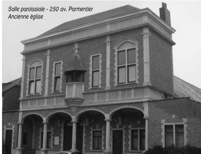
Salle paroissiale - 250 av. Parmentier Ancienne église

Un magnifique mémorial consacré au Cœur Immaculé de Marie fut placé le 5 mai 1943 devant le Cloître de l'église.