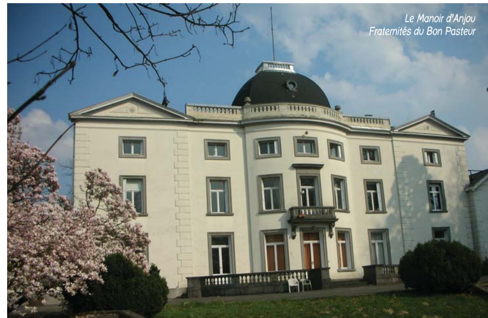
Le Manoir d'Anjou Fraternités du Bon Pasteur

L'accueil revêt de nombreux visages : c'est d'abord l'accueil mutuel, la reconnaissance de