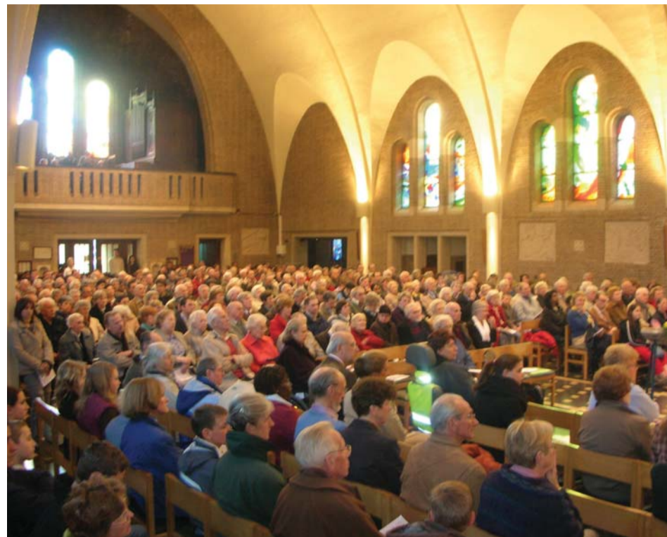
Célébration à Ste-Alix