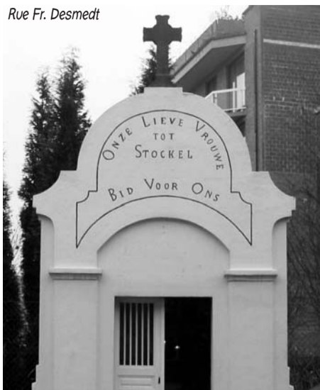
Rue Fr. Desmedt

Elle était entourée de plusieurs magnifiques tilleuls dont les frondaisons lui formaient une immense couronne. Malheureusement, lors de l'élargissement de la rue en 1912, les arbres furent condamnés et la chapelle déplacée rue Fr. Desmedt, à son emplacement actuel.