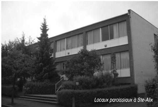
Locaux paroissiaux à Ste-Alix

(3) Bilingue avec prédominance du néerlandais, sauf juillet & août.