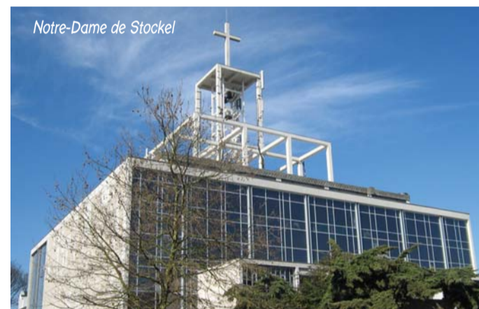
Notre-Dame de Stockel