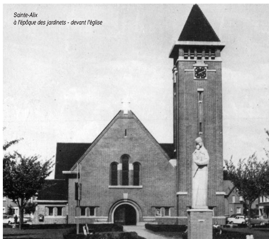
Sainte-Alix à l'époque des jardinets - devant l'église