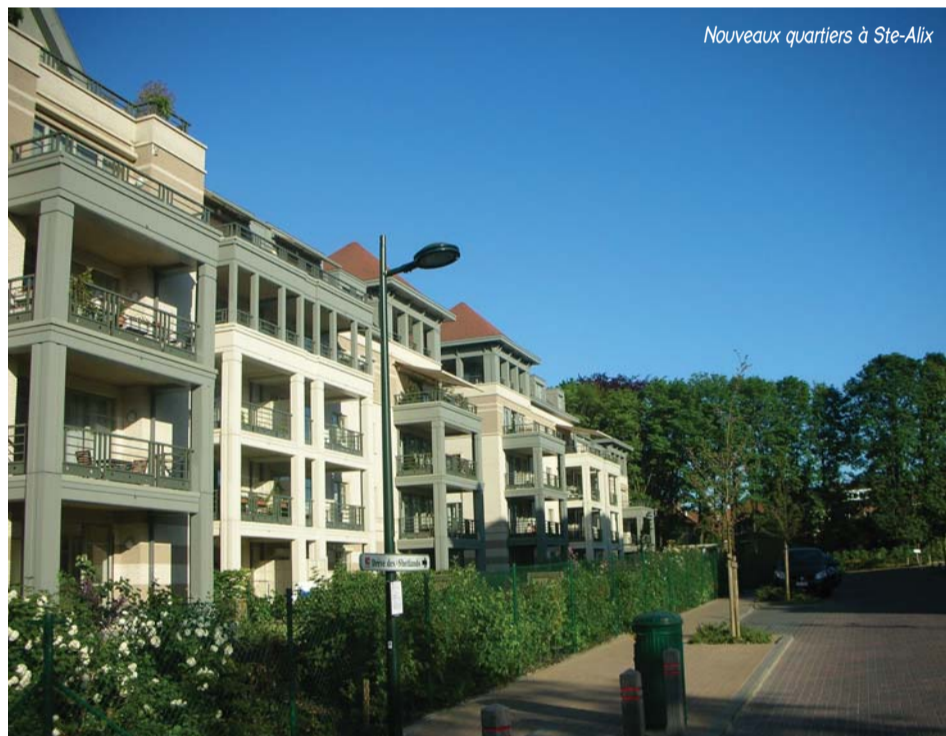
Nouveaux quartiers à Ste-Alix

Construite en 1935-1936, la bénédiction de l'église a eu lieu le dimanche 26 juillet 1936 et la célébration était présidée par le Cardinal Van Roey, alors archevêque de Malines (Bruxelles).