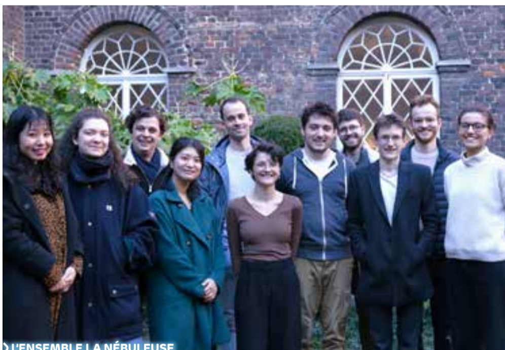
L'ENSEMBLE LA NÉBULEUSE