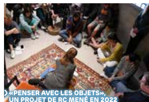
«PENSER AVEC LES OBJETS», UN PROJET DE RC MEN  EN 2022