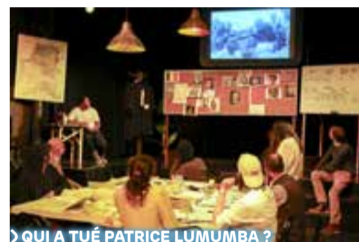
«QUI A TU  PATRICE LUMUMBA?»