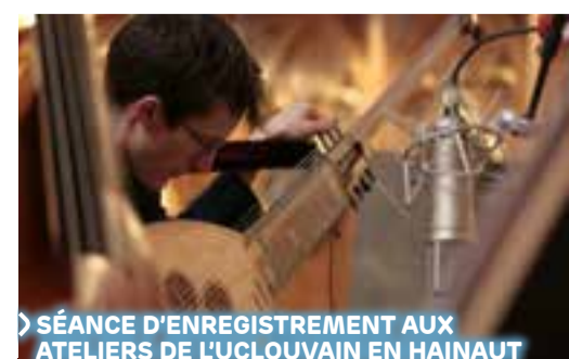
SÉANCE D'ENREGISTREMENT AUX ATELIERS DE L'UCLouvain EN HAINAUT