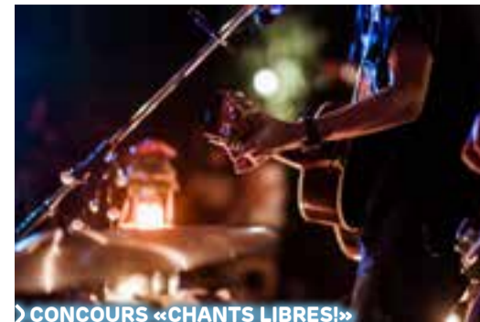
› CONCOURS «CHANTS LIBRES!»