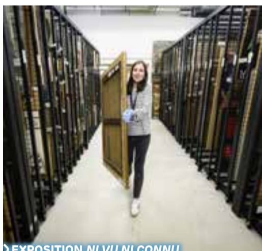
> EXPOSITION NI VU NI CONNU