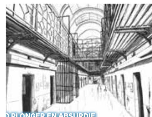
> PLONGER EN ABSURDIE