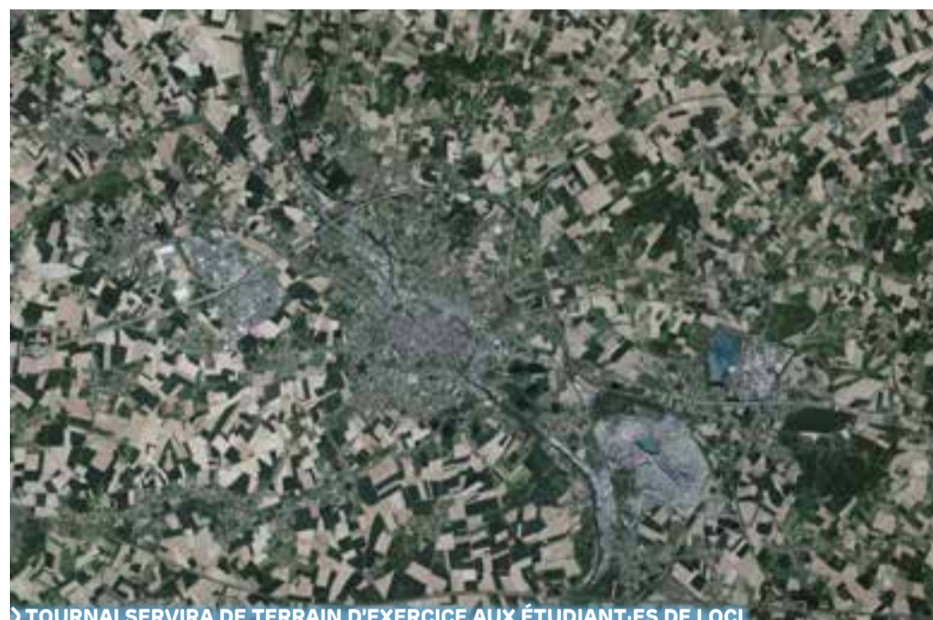
TOURNAI SERVIRA DE TERRAIN D'EXERCICE AUX ÉTUDIANT·ES DE LOCI.