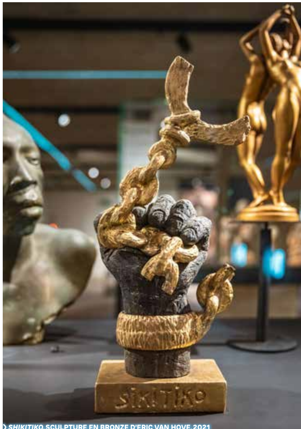
SHIKITIKO. SCULPTURE EN BRONZE D'ERIC VAN HOVE, 2021

Tous ces témoignages d'expert·es, auxquels j'ajoute le dialogue avec les étudiant·es et les pièces qu'ils et elles ont produites, ainsi que les nombreux échanges, dans la cartothèque de la Bibliothèque des sciences et technologies (qui rassemble de nombreuses cartes et ouvrages relatifs à l'Afrique coloniale, avec des données minérales, archéologiques, industrielles ou politiques...), dans la réserve patrimoniale, dans le Musée L ou ailleurs, avec des chercheur·euses, des archivistes, des professeur·es, des étudiant·es issus de différentes facultés, tous ces apports ont rendu cette expérience très enrichissante. Avec l'appui d'UCLouvain Culture, j'envisage de publier en 2026 un ouvrage rassemblant tous ces éléments qui alimentent la réflexion sur l'héritage du colonialisme et les tiraillements de la modernité.