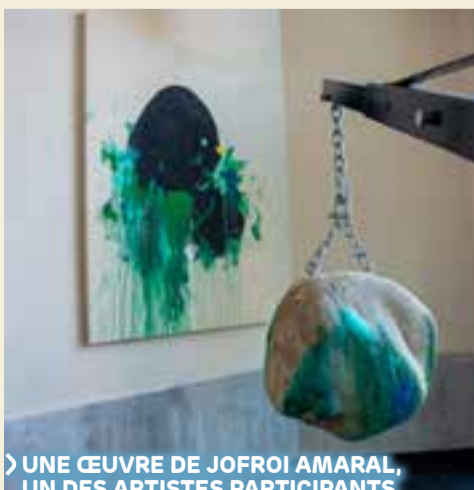
UNE ŒUVRE DE JOFROI AMARAL, UN DES ARTISTES PARTICIPANTS