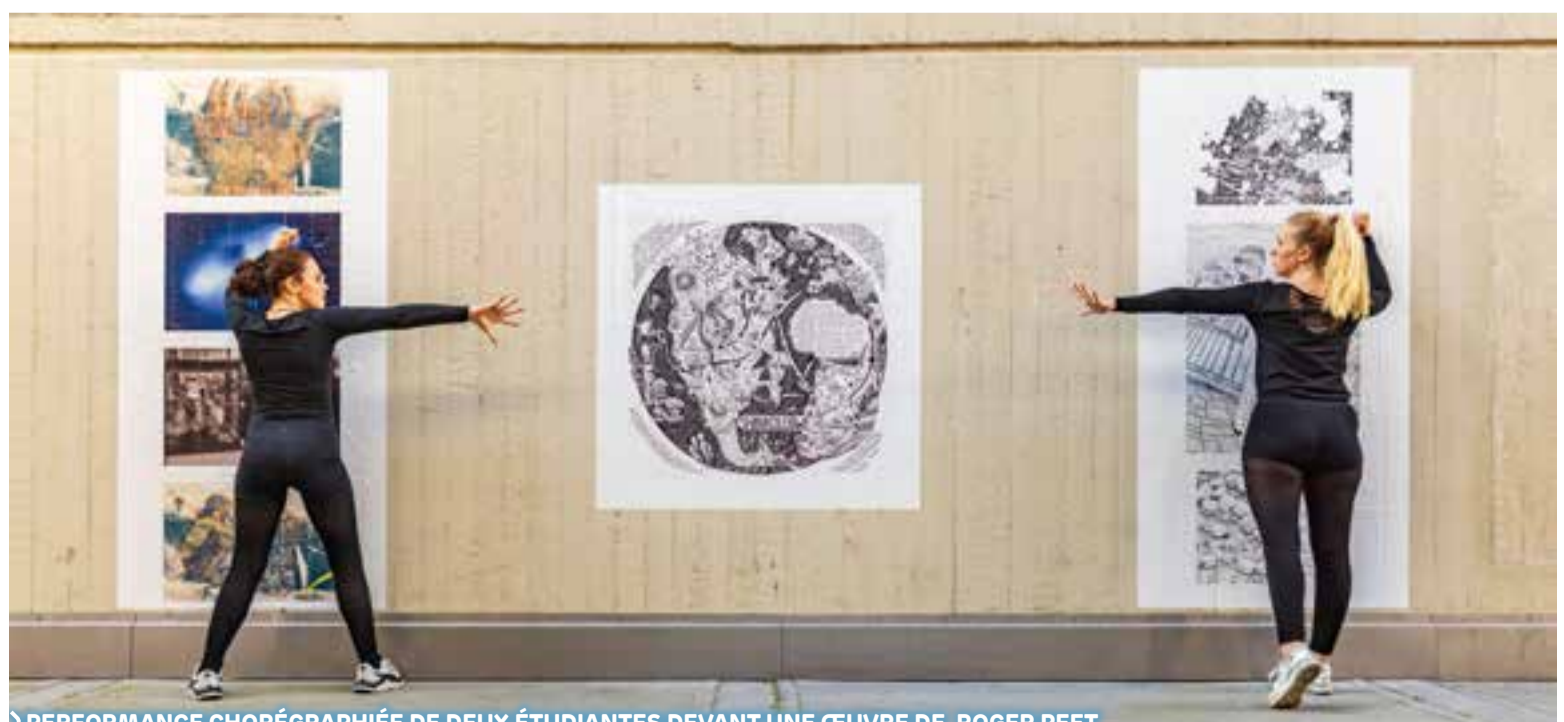
PERFORMANCE CHORÉGRAPHIÉE DE DEUX ÉTUDIANTES DEVANT UNE ŒUVRE DE ROGER PEET