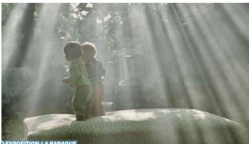
> EXPOSITION LA BARAQUE