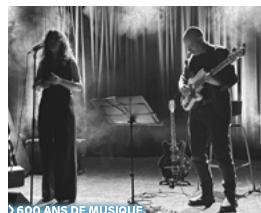
› 600 ANS DE MUSIQUE