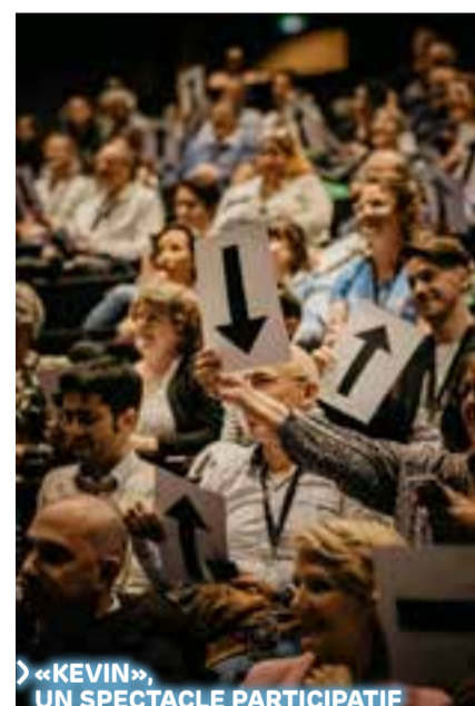
«KEVIN», UN SPECTACLE PARTICIPATIF