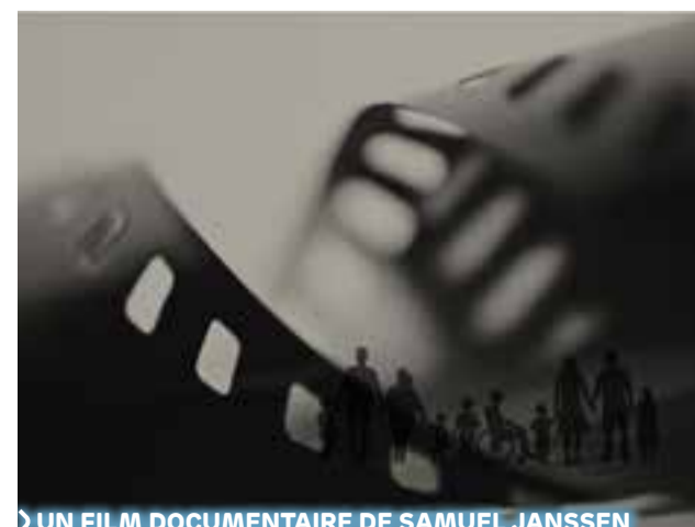
UN FILM DOCUMENTAIRE DE SAMUEL JANSSEN

participer, avec chaque campus, à l'élaboration et à la mise en place d'une nouvelle gouvernance pour redéployer le multisite en matière de culture. Pour que de tels projets puissent continuer de voir le jour et se déployer davantage encore!