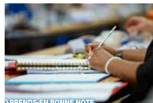
› PRENDS-EN BONNE NOTE